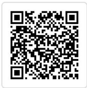
离退休教职工 医疗保健指南