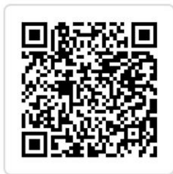
“北京通——养老助残卡” 办理使用指南

温馨提示： 在线办理北京通·养老助残卡延期业务时，用户需使用具有 NFC 功能的安卓手机，苹果用户暂时无法使用 iPhone 对卡片进行贴卡延期操作。