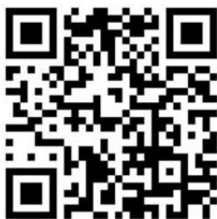
离退休教职工信息 登记表二维码

请您携带学校人事处开具的报到凭据到离退休工作处办理退休报到手续，填写纸质版表格或者扫描二维码填写信息登记表。